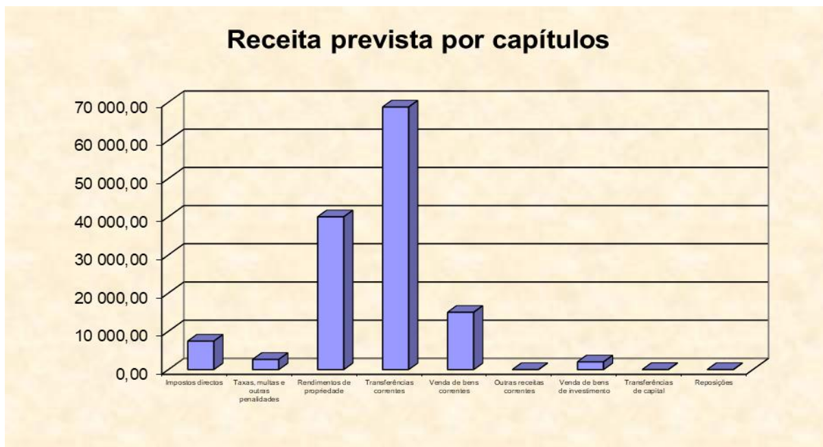
Gráfico n.º 1- receita prevista por capítulos